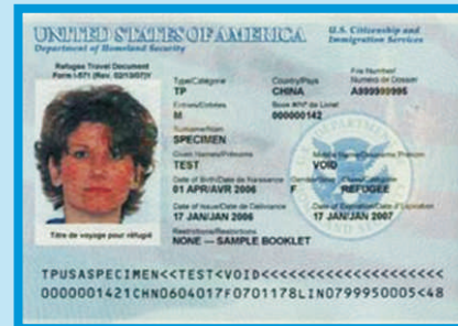
DOCUMENTO DE VIAJE DE REFUGIADO