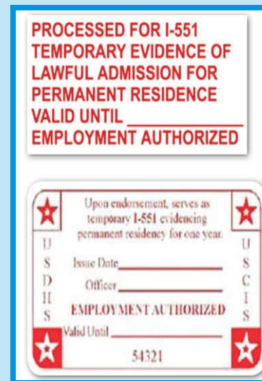
SELLO DE IDENTIFICACIÓN Y DE TELECOMUNICACIÓN DE DOCUMENTACIÓN DE EXTRANJERO (ADIT)