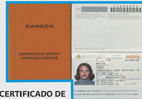
CERTIFICADO DE IDENTIDAD