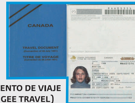
DOCUMENTO DE VIAJE (REFUGEE TRAVEL)