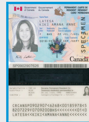
TARJETA DE RESIDENTE PERMANENTE