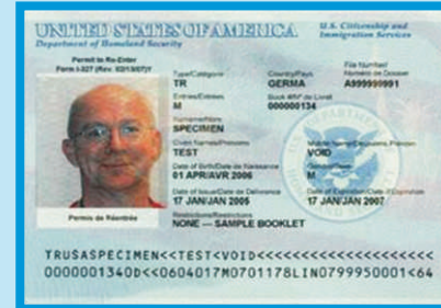
PERMISO DE REINGRESO