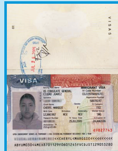
VISA DE INMIGRANTE